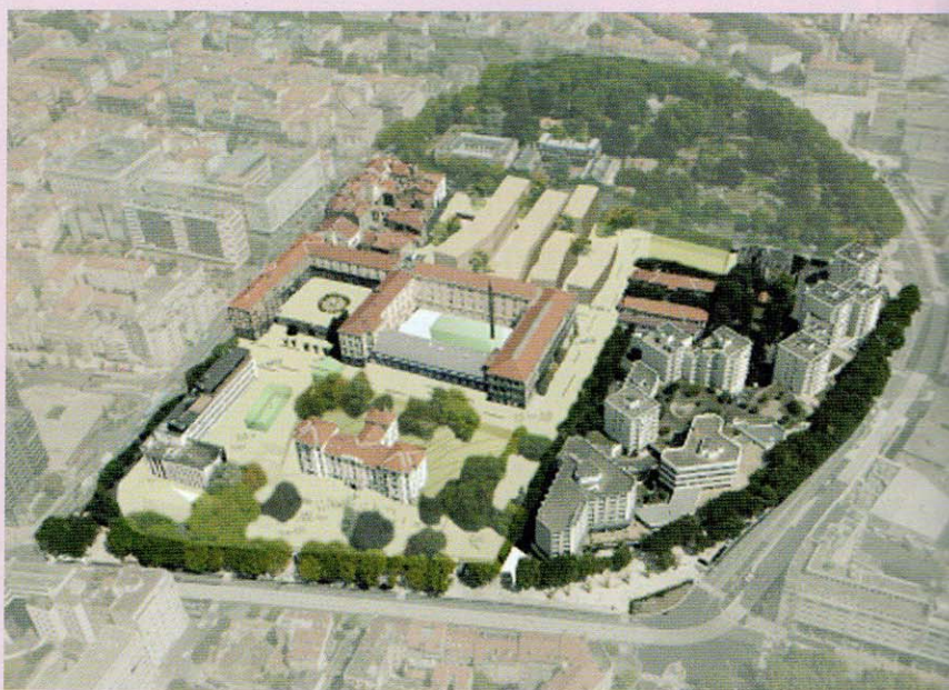
L'Hôtel Dieu, 1 er projet

Les nouveaux logements placés sur le site illustrent la notion de "mixité". Milieux sociaux, générations et modes de vie se mélangent. La "terrasse insérée" est une surface verte protégeant la végétation et les arbres existants, et permettant de nouveaux espaces de loisirs et d'activités d'extérieur. SUB-TERRA / SUPRA-TERRA est imaginée de manière à produire un milieu durable, respectueux de l'environnement. Elle utilise les technologies d'aujourd'hui pour répondre aux besoins en chauffage et climatisation, et aux nécessités de réduction des dépenses énergétiques. Elle peut accueillir des arbres plantés en pleine terre ; des bassins peu profonds apporteront leur fraîcheur, des panneaux solaires seront implantés, et des faîtières et toits vitrés seront installés pour la climatisation des espaces intérieurs". L'avis du jury : "Ce projet, innovant, s'appuie sur la typologie complexe du site. En jouant de façon habile sur le dessus et le dessous, il rappelle l'environnement volcanique de la ville de Clermont-Ferrand. Par cette approche de socles et strates habitées, une liaison visuelle s'établit entre les parties du site et